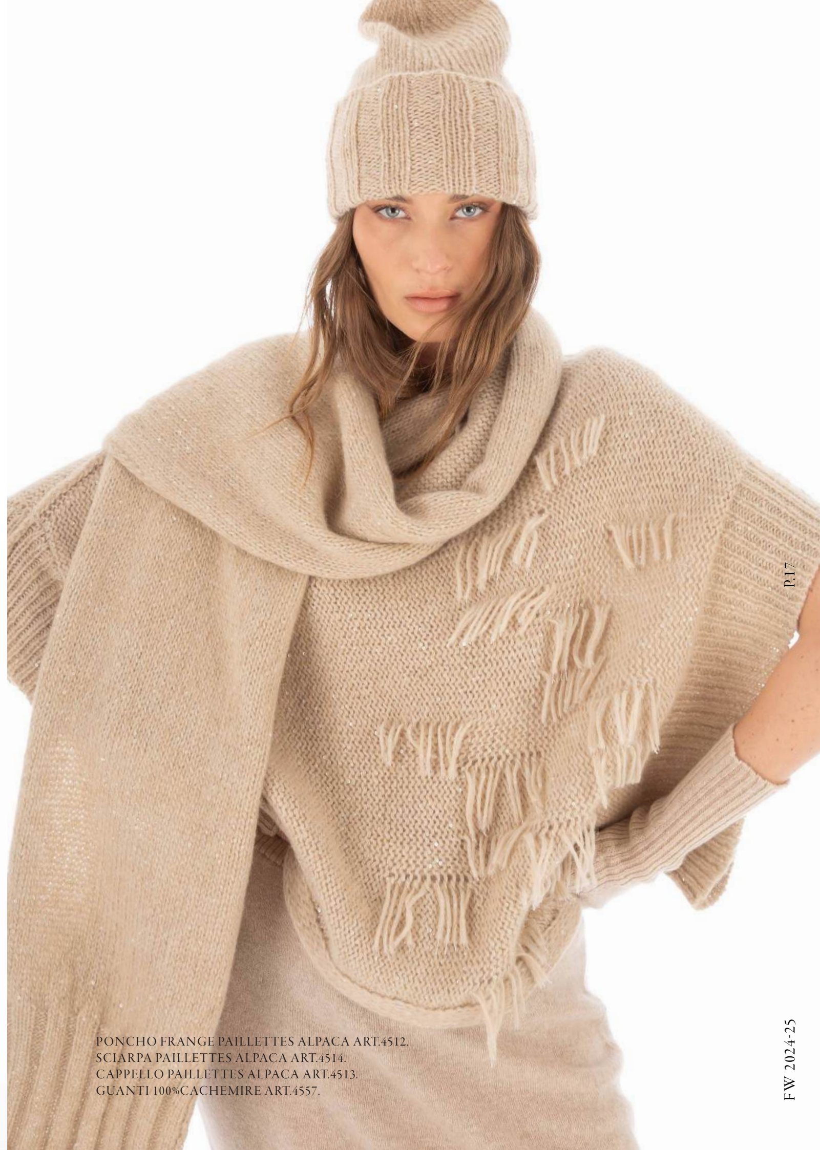
PONCHO FRANGE PAILLETES ALPACA ART.4512. SCIARPA PAILLETES ALPACA ART.4514. CAPPELLO PAILLETES ALPACA ART.4513. GUANTI 100% CACHEMIRE ART.4557.